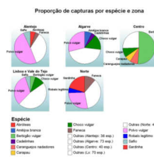
Repartição das capturas totais em peso, por espécies, por zona