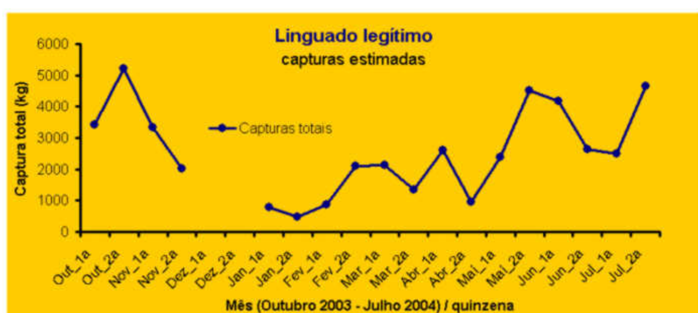
Capturas totais de linguado legítimo da frota artesanal