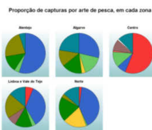
Contribuição de cada arte para o total das capturas em peso em cada zona