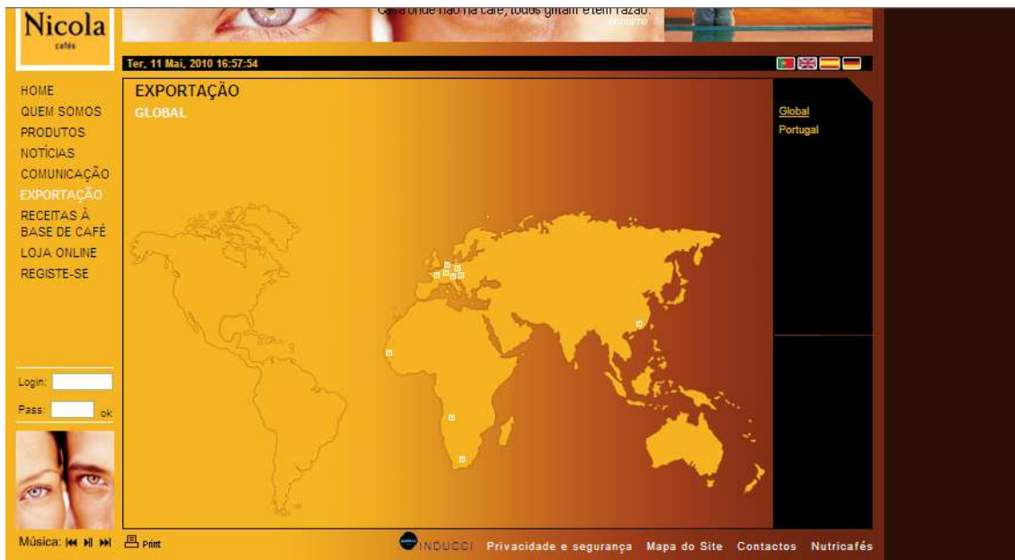
Ilustração 4 - Exportações

Outro ponto muito interessante, principalmente para as donas de casa que gostam de ser criativas na cozinha, é o tema Receitas à Base de Café , que apresenta ao visitante do site uma série de receitas de doces que, como é óbvio, levam café na sua composição. Este ponto permite ainda que os visitantes registados no site, escrevam e enviem as suas próprias receitas!