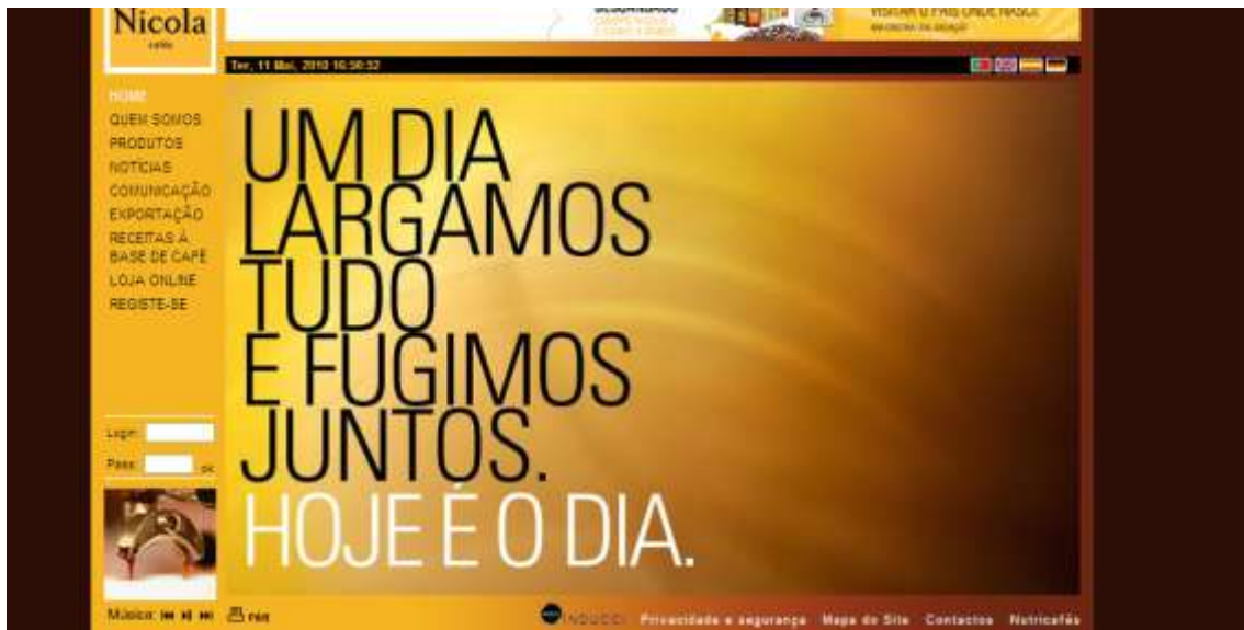
Ilustração 1 - Home

Frases como esta, tornaram-se a imagem de marca da Nicola e muito conhecidas por todo o país. Achamos que servem de incentivo às pessoas para que elas façam coisas inspiradoras e não muito habituais no dia-a-dia.