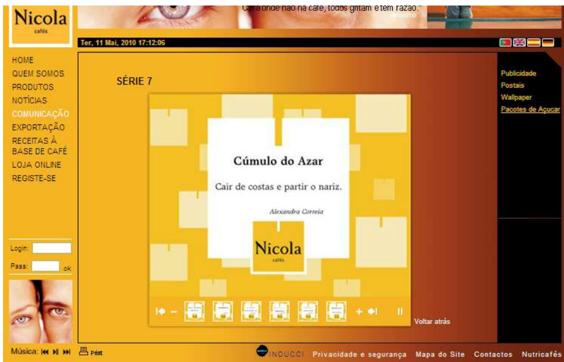
Ilustração 3 - passatempos dos pacotes de açúcar Nicola

O site contém ainda o tópico da Exportação que nos mostra dois mapas com os principais pontos de exportação Nicola tanto a nível nacional como a nível global.